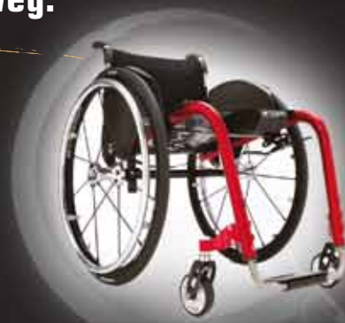
Progeo ▶ Joker Evolution