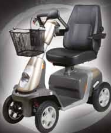
◀ Trophy Een scooter met een unieke vering en lichte bediening

ERVAAR HET GEVOEL VAN ECHTE ONAFHANKELIJKHEID