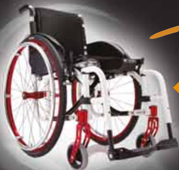
◀ Progeo Exelle Vario

Uw mobiliteit is onze grootste zorg. Wij helpen u graag terug op weg.